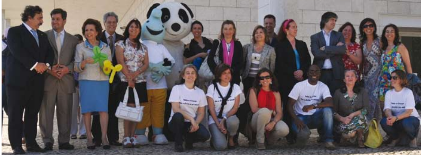
REPRESENTANTES DAS INSTITUIÇÕES QUE ASSINARAM A CARTA DE COMPROMISSO