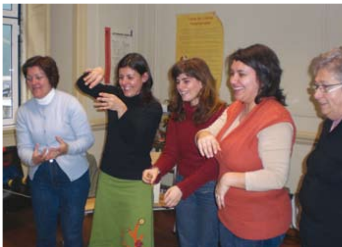
ACÇÃO DE FORMAÇÃO: "ACTIVIDADE LÚDICA E NOVAS TECNOLOGIAS"

O Agrupamento de Escolas Ribeiro de Carvalho do Ca-