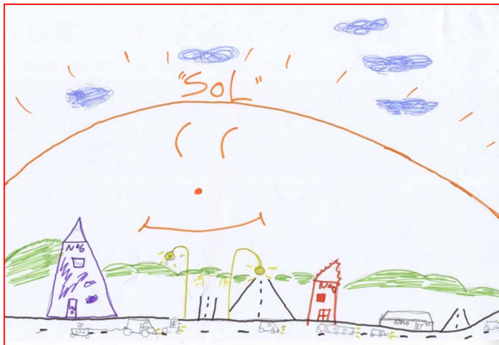
MENINO – 9 ANOS