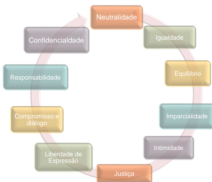
Figura 2 – Perfil de um mediador

Apesar dos conflitos fazerem parte da natureza humana e social, as escolas devem adotar estratégias de prevenção face aos mesmos, tendo como objetivo garantir a integridade física e psicológica dos (as) alunos. Mais do que isto, a prevenção dos conflitos é essencial para a escola assegurar o sucesso.